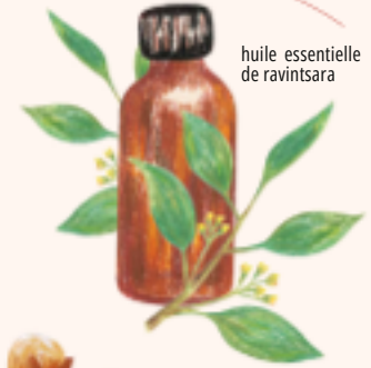
huile essentielle de ravintsara