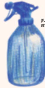
pulvérisateur en plastique