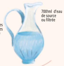
700ml d’eau de source ou filtrée